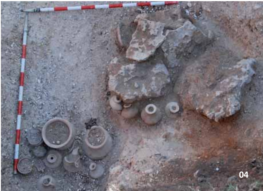
04 Tumba 127a y 127b in situ . Se trata de un conjunto doble sincrónico de una niña de corta edad y una mujer adulta datable hacia el final del siglo II a.C.