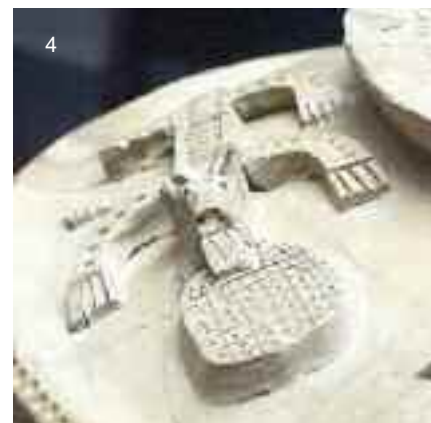
Torques de plata con nodus herculeus del tesoro núm. 1 de Las Quintanas de Pintia (1) y detalle del mismo (2) que podría estar imitando la iconografía del “zoomorfo en perspectiva cenital” representado en piezas como el broche de cinturón áureo (3) del tesoro núm. 2 de Arrabalde (Zamora) (según G. Delibes y A. Esparza), o la vasija de almacenamiento (4) recuperada en Roa de Duero (Burgos), la vieja Rauda .

se encuentran en el mundo helenístico y faltan claros nexos ibéricos, podría disiparse, en alguna medida, de ser interpretados como representaciones igualmente de animales en perspectiva cenital, a cuya mirada y percepción sin duda los vacceos y sus vecinos estarían más acostumbrados que nosotros. Para su introducción desde el ámbito mediterráneo al interior peninsular se ha valorado, aunque con reservas, el mundo púnico, desde Gadir donde el motivo, que no su asociación al torques, se documenta a partir del culto que mantuvo la ciudad en el templo dedicado al Hércules gaditano. Esta vía alternativa al mundo helenístico podría cobrar mayor peso ahora que en Pintia hemos hallados piezas como la cuenta de collar del Jano bifronte de la tumba 144 o el colgante-amuleto consistente en un figura de un personaje togado, de pasta vítrea verdosa, recuperado superficialmente. Así pues, sobre el motivo de un nodus herculeus importado, los vacceos realizarían su propia interpretatio , visualizando el característico animal en perspectiva cenital; ello justificaría el arraigo de este tipo de torques en la Meseta, con ocho ejemplares frente al único de Menjíbar en Andalucía, considerado incluso este préstamo meseteño.