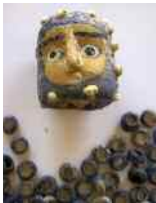
Colgantes en pasta vítrea de Pintia : sobre estas líneas un personaje togado hallado superficialmente en el poblado de Las Quintanas; a la izquierda abalorios elipsoidales junto a un cuenta policroma de Jano bifronte, de la tumba 144 de Las Ruedas