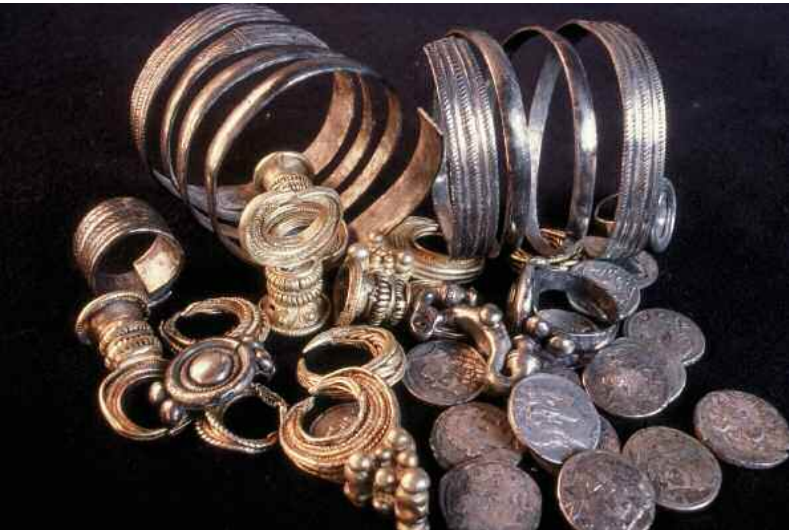
Tesorillo número 2 de Las Quintanas, Pintia .

años— para que sus nobles familias hubieran concebido fundadas esperanzas de que alcanzaran la etapa adulta y, en consecuencia, para que hubieran experimentado una enorme frustración y duelo por su pérdida: en el terreno afectivo, lógicamente, lo que explicaría en gran medida la riqueza de las ofrendas y ajuares funerarios presentes en ambas tumbas —50 y 100 objetos respectivamente—, pero también en un aspecto mucho más pragmático, como sería la pérdida de un elemento clave de las relaciones estratégicas intercomunitarias, a través de la práctica exogámica probablemente no muy lejana ya a esa edad, y de la deseada descendencia, pues, como ha señalado Teresa Chapa, “la infancia es un sector de importancia vital para cualquier grupo humano, puesto que de su existencia y formación depende la reproducción física e ideológica de la población como unidad diferenciada”. En dicha reproducción social debió de tener una gran importancia el establecimiento y mantenimiento de dichas relaciones intercomunitarias a través del matrimo-