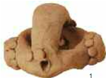
Diversos modelos de Fíbula Anular Hispánica: en cerámica (1), procedente de la tumba 153 de la necrópolis de Las Ruedas de Pintia ; en bronce (2), de la tumba 31 de Miraveche (Burgos); en plata con recubrimiento de chapa y filamentos áureos (3), de San Martín de Torres (León).

La cronología baja de estas producciones, acorde al proceso de conquista romana para la zona, no debe llevarnos a confundir el contexto de ocultación de estos tesorillos, con su génesis y más que probable herencia de generación en generación. En este sentido, el atavismo del modelo queda perfectamente de manifiesto en la consideración del peculiar y exclusivo sistema de ensamblaje de anillo y puente en este modelo. En el ejemplar de San Martín de Torres la pérdida de la chapa áurea de recubrimiento de esa