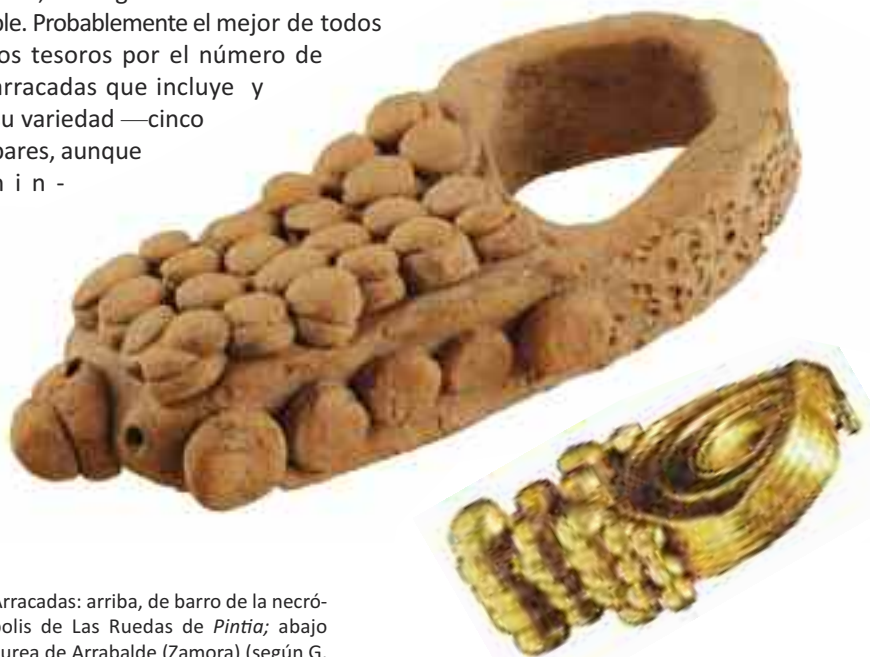
Arracadas: arriba, de barro de la necrópolis de Las Ruedas de Pintia ; abajo áurea de Arrabalde (Zamora) (según G. Delibes y A. Esparza).

En suma, hemos visto diversos objetos de orfebrería que tienen sus equivalentes en otros metales no nobles, ya sean el bronce o el hierro, y cuya cronología nos remite a los siglos II-I a.C., fechas que tradicionalmente han sido las barajadas para la orfebrería meseteña. Pero también hemos presentado tres piezas de cerámica, inéditas hasta ahora, que imitan diferentes tipos de joyas áureas. Imitación que se concreta en aspectos formales, pero también decorativos, aludiendo ya sea a la filigrana —mediante una serie de trazos incisos oblicuos en los zarcillos, o multitud de finas y desordenadas impresiones frontales en las arracadas—,