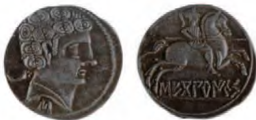
Denario celtibérico de Sekobirikes (fines del siglo II-inicio del I a.C.) (Colección Real Academia de la Historia). El anverso reproduce una cabeza masculina con torques y diversos símbolos, mientras en el reverso aparece un jinete lancero y, debajo, la leyenda monetaria, en alfabeto ibérico, con el nombre de la ciudad.

Además, el número de asentamientos crece, como también lo hacen los cementerios conocidos. El número