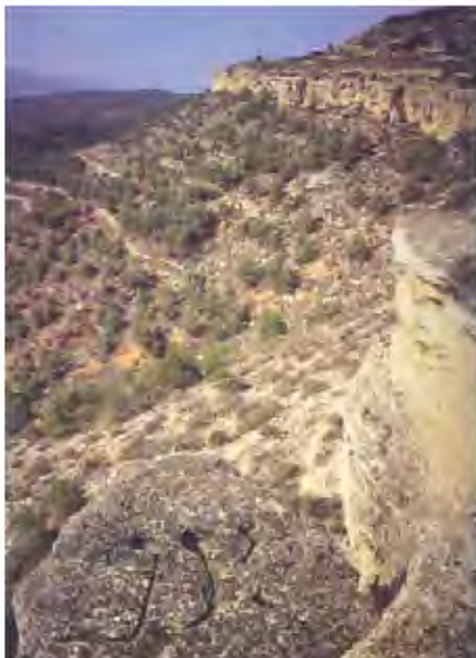
Santuario de Peñalba de Villastar (Teruel) (Foto M. Almagro-Gorbea), el más conocido de los lugares de culto de la Celtiberia. Se sitúa en la cima de una montaña, a cuyo pie discurre el río Turia, coronada por un farallón de caliza blanquecina en el que se documentaron más de veinte inscripciones, en una de las cuales se ha identificado el nombre del dios céltico Lug (en primer término, cazoleas rituales).

frutos secos (bellotas), y pobre en proteína animal.