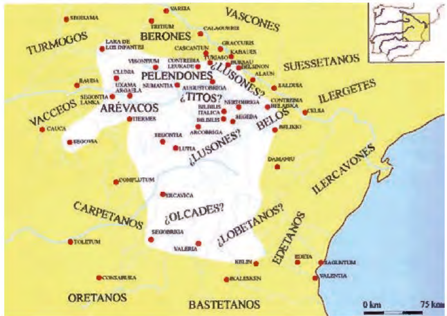
La Celtiberia: ciudades y etnias (siglos III-I a.C.) (según Lorrio).

Los celtíberos serían un grupo étnico, al igual que los galos o los iberos, pues incorporan entidades de menor categoría, como los arévacos, belos, titos, lusones y pelendones. Otros pueblos, como los olcades, podrían haber pertenecido también a los celtíberos, pero no son mencionados por las fuentes como tales. El análisis de tales etnias, y su delimitación mediante la localización de sus ciudades, permite determinar unos límites para la Celtiberia que en modo alguno hay que considerar inmutables. En este sentido pueden valorarse los apelativos que acompañan a ciertas ciudades, haciendo referencia a su carácter limítrofe, como Segobriga, caput Celtiberiae , en Cuenca, Clunia, Celtiberiae finis , en Burgos, o Contrebia Leucade, caput eius gentis (en referencia a los celtíberos), en La Rioja. De esta forma, la antigua Celtiberia se extendería por las altas tierras de la Meseta Oriental y la margen derecha del Valle Medio del Ebro, englobando, en líneas generales, la actual provincia de Soria, buena parte de Guadalajara y Cuenca, el sector oriental de Segovia, el Sur de Burgos y La Rioja