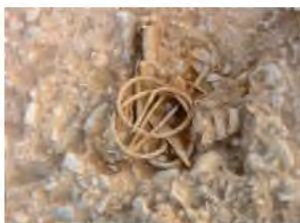
Tumba 'aristocrática' de la necrópolis de Carratiermes (ca. siglo V a.C.) (Montejo de Tiermes, Soria). Las armas que integran este ajuar (espada de antenas, soliferrum , lanza y escudo) aparecieron dobladas intencionadamente, lo que generalmente se relaciona con condicionantes rituales, según los cuales la 'muerte ritual' del arma sería la forma de enviar estos objetos al Más Allá.

considerar que esos "celtíberos antiguos" de las altas tierras de la Meseta Oriental constituyen el precedente inmediato de los que aparecen en las fuentes literarias a partir de finales del siglo III a.C. Otro problema es el de establecer desde cuándo se configuraron realidades étnicas del tipo de las de los arévacos, los belos o los pelendones. Para el caso arévaco, el étnico, de acuerdo con Plinio habría sido tomado del río Areua , tradicionalmente identificado con el río Araviana, cuyo naci-