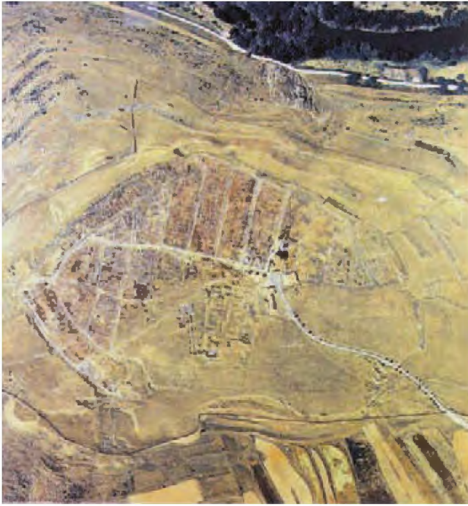
Vista aérea de Numancia y su trazado urbanístico (según Jimeno ed. 2005). Tenemos pocos datos sobre el urbanismo de la ciudad destruida el 133 a.C., pero sabemos que la del siglo I a.C. y la romana imperial presentan un urbanismo en retícula, que se estructuraría, seguramente desde su origen, a partir de dos calles paralelas de dirección Noreste-Suroeste cruzadas por otras once también paralelas, sin dejar espacios libres para plazas o lugares de reunión.