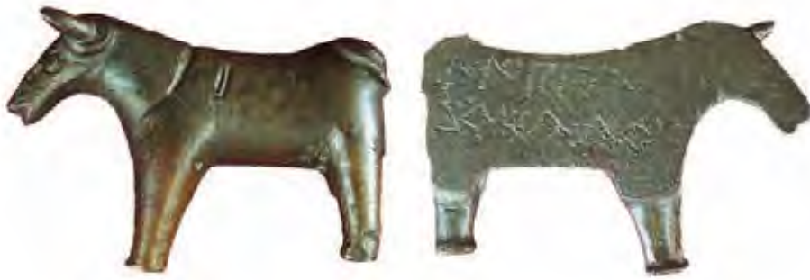
Tésera de hospitalidad de Contrebia Carbica (Villas Viejas, Cuenca) (fines del siglo II-inicio del I a.C.) (Colección Real Academia de la Historia), la primera de estas piezas hallada y dada a conocer. Estos característicos objetos se relacionarían con la práctica del hospitium , que consistía en la aceptación de un extranjero por un grupo familiar o una comunidad determinada. Presenta forma de toro y en el reverso se hace referencia a uno de los participantes en el pacto, la ciudad berona de Libia.

de tumbas de algunas necrópolis da una idea de ello, aunque en muchos casos, dada la larga secuencia de uso de estos cementerios, tales cifras engloben también las sepulturas pertenecientes a la fase anterior o posterior, lo que al tratarse de excavaciones antiguas no siempre es posible de determinar. El número de enterramientos varía notablemente de unos cementerios a otros, pues en Aguilar de Anguita se excavaron unas 5.000 tumbas, en Luzaga se acercaban a 2.000, Gormaz ofreció unos 1.200 enterramientos, Osma y Quintanas de Gormaz superaron los 800, en Almaluez se documentaron 322 tumbas, mientras Alpanseque y Arcóbriga proporcionaron en torno a los 300 conjuntos y La Mer-