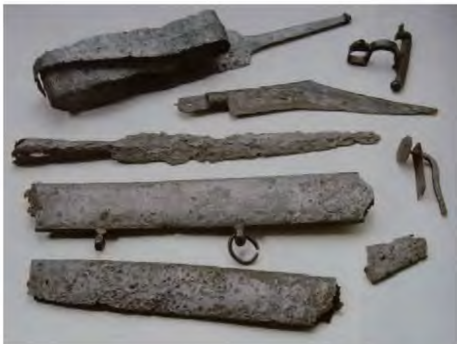
Ajuar de guerrero de Quintanas de Gormaz (Soria) (finales del siglo IV-inicios del III a.C.). La tumba incluye una espada de La Tène, tipo que se introduce en las panoplias celtibéricas durante los últimos años del siglo IV a.C., para alcanzar su mayor desarrollo durante el III, cuando aparecen las producciones locales. La pieza, de producción foránea, pudo haber llegado a la Celtibérica de la mano de un mercenario celtibérico, aunque también pudiera tratarse de una importación de lujo.