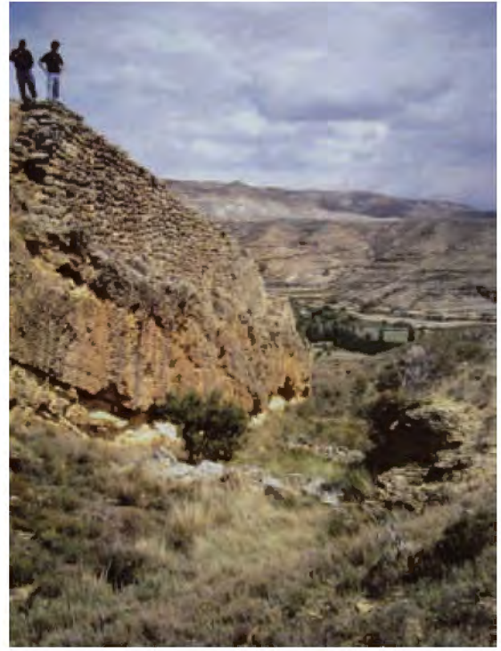
Muralla y foso de Contrebia Leukade (Inestrillas, La Rioja), el más espectacular y el mejor conocido de los identificados en territorio celtibérico. Excavado en la roca en un perímetro de casi 700 m con una anchura entre 7 y 9 m y una profundidad de 8 m, con un volumen de piedra extraída de cerca de 45.000 m 3 , utilizada en la construcción de la muralla, de la que queda separado por un estrecho espacio.

los enterramientos de esta fase inicial. Algunos de estos cementerios, como el de Carratiermes (Soria), llegaron a estar en uso desde el siglo VI hasta el I a.C. o incluso después; las sepulturas aparecieron distribuidas en dos sectores de enterramiento, separados entre sí unos 200 m, con las sepulturas más antiguas ocupando el área central de la zona de la que proceden la mayoría de los conjuntos excavados.