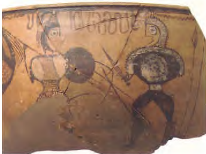
‘Vaso de los guerreros’ de Numancia en el que se ha representado una lucha de campeones o combate singular (siglo I a.C.). Los guerreros protagonistas de estos duelos, que aparecen armados con espadas, lanzas, jabalinas, cascos, escudos y grebas, pertenecían a la elite social y militar. A través del duelo se pretende conseguir prestigio y reconocimiento social, si bien no hay que olvidar el contenido ritual y ordálico de este tipo de prácticas de profundo significado y larga tradición.

bronce, las representaciones monetales y la producción cerámica, destacando las cerámicas monocromas y policromas de Numancia. A la vez se desarrollará un proceso de ordenación jerárquica del territorio, en el que el carácter urbano de los oppida se define por su significado funcional más que por el arquitectónico, aunque se sepa de la existencia de edificios públicos. La aplicación de modelos urbanísticos ortogonales tiene su reflejo en La Caridad de Caminreal (Teruel), en el Valle del Jiloca, ciudad construida por iniciativa romana a finales del siglo II a.C. y destruida en el curso de las Guerras Sertorianas, que presenta un urbanismo reticular, con calles perpendiculares entre sí carentes de enlosado aunque provistas de aceras y canales de captación y evacuación de aguas, con insulae de casas rectangulares, siendo la más conocida la llamada Casa de Likine , una mansión helenístico-