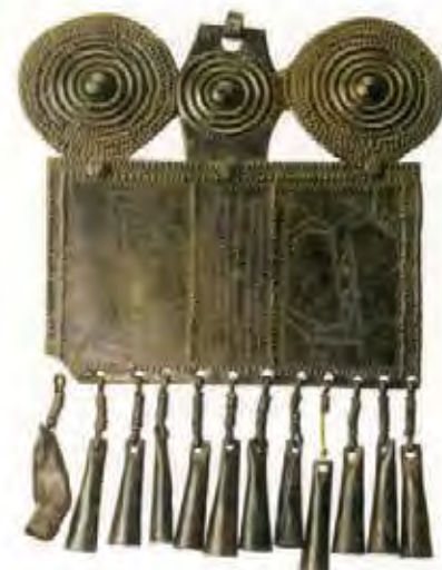
'Pectoral' de placa de Carratiermes (ca. 600-450 a.C.). Este cementerio ha proporcionado un destacado conjunto de estos objetos de prestigio que eran utilizados por individuos de posición social elevada, tanto hombres como mujeres o, incluso, niños. Aparecen en tumbas con otros adornos y están decorados con círculos concéntricos, que se relacionan con elementos astrales, y cérvidos, animal que representa en la mitología celta la fertilidad, la velocidad y el prestigio.

Durante el Celtibérico Antiguo (ca. 600-450 a.C.) se registran en las altas tierras de la Meseta Oriental y el Sistema Ibérico importantes novedades, algunas de las cuales van a caracterizar la Cultura Celtibérica hasta sus fases más avanzadas. Surgen ahora los primeros asentamientos estables en este territorio, generalmente del tipo conocido como "castro", localizados en cerros de fácil defensa, a veces protegidos por murallas. Las casas, de zócalo de piedra y alzado de adobes, eran de planta rectangular, con muros medianiles comunes, cuyas traseras se cierran hacia el exterior, a modo de muralla, o se adosan a ésta, y puertas abiertas al interior del castro, donde se documenta un espacio central, a modo de calle o plaza. Este modelo será el tipo de vivienda celtibérica hasta época tardía. Los poblados más grandes apenas tendrían unos pocos centenares de habitantes, no se observa jerarquización del territorio y las comunidades debieron ser pequeñas, bastante homogéneas y autosuficientes, siendo su base económica preferentemente agropecuaria. En la serranía norte de la provincia de Soria se individualiza durante la Primera Edad del Hierro la denominada 'cultura castreña soriana'. Se trata de pequeñas comunidades de ca-