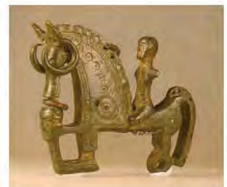
Fíbula de caballito con jinete (ca. 175-125 a.C.), sin procedencia segura. Presenta una cabeza humana que cabe relacionar con la costumbre celta, señalada por las fuentes literarias, de colgar de la cabeza de los caballos, como trofeo, la cabeza cortada de los enemigos muertos. Constituyen uno de los elementos más peculiares y representativos de la cultura céltica de la Península Ibérica, conociéndose más de 150 ejemplares con una importante concentración en el territorio celtibérico. Serían distintivo de elite social como símbolo de pertenencia a la clase de los equites .

El Celtibérico Tardío (finales del III - siglo I a.C.) se configura como un período de profundo cambio, pudiéndose considerar como el hecho más destacado, posiblemente, la tendencia hacia formas de vida cada vez más urbanas. En relación con este proceso de urbanización estaría la probable aparición de la escritura, que se documenta ya mediado el siglo II a.C. en las acuñaciones numismáticas, pero la diversidad de alfabetos y su rápida generalización permiten suponer una introducción anterior desde las áreas ibéricas meridionales y orientales. Este proceso contribuyó, igualmente, de forma decisiva, al desarrollo de las manifestaciones artísticas celtibéricas, como la orfebrería, el trabajo del