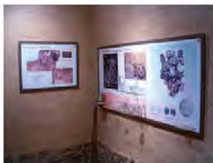
Aula Arqueológica de Arrabalde (Zamora).