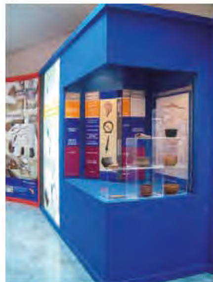
Aula Arqueológica de Manganese de la Polvorosa (Zamora).

camiento y un gran merendero que, si no fuese por el paisaje montañoso, bien podría recordarnos un poblado hawaiano. En Roa (Burgos) está a punto de abrirse otro lugar parecido, al menos por lo que se ve desde el exterior, encaminado en la misma dirección, pero con los caracteres propios de la cultura vaccea en vez de la astur (las viviendas reproducidas son de planta