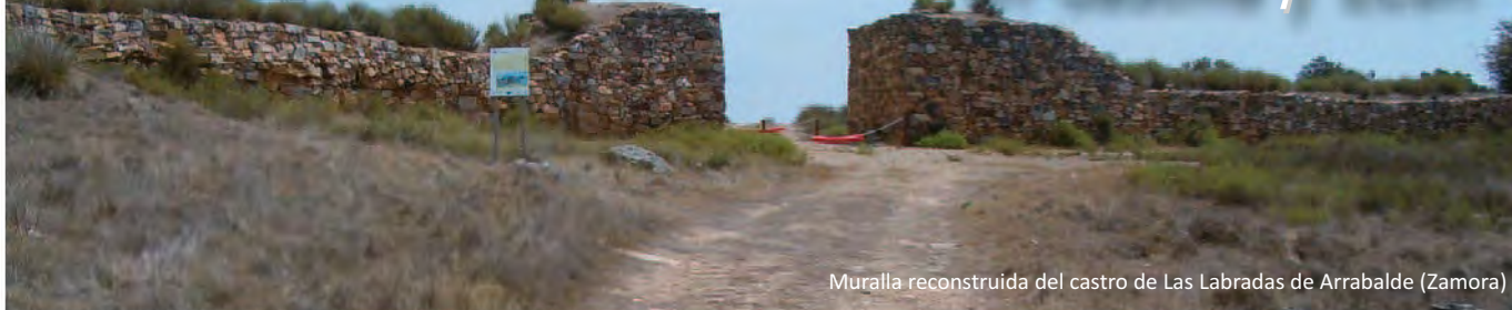
Muralla reconstruida del castro de Las Labradas de Arrabalde (Zamora)

La expresión “puesta en valor”, que se aplica en tantos ámbitos de la actividad humana, no es más que un eufemismo que, por lo visto, está de moda. El significado de la expresión en nuestro contexto, metáforas y abstracciones aparte, podría ser algo así como “colocar en el lugar correspondiente” algo que no lo está, es decir, muy similar a la palabra más señera “restaurar”. Pero el término “valor”, en el diccionario de la Real Academia Española, se define como la aptitud de una cosa para satisfacer necesidades y proporcionar deleite, y como el rédito de una hacienda. Probablemente, “poner en valor” el patrimonio cultural esté más relacionado en el imaginario colectivo con la primera acepción, pero en la maquinaria político-burocrática-administrativa lo está con ambas por igual.