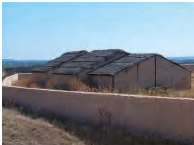
Parque arqueológico de Roa de Duero (Burgos).