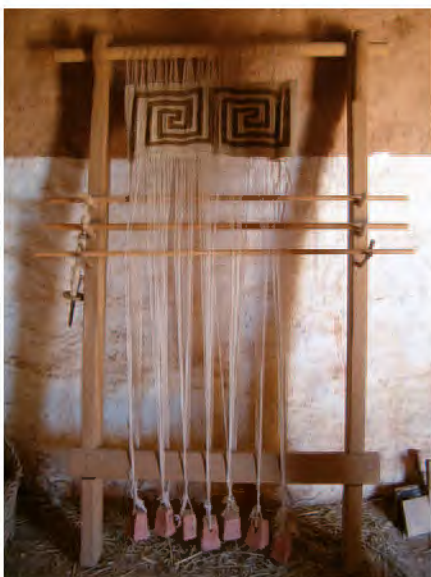
Interior con reconstrucción de telar de una de las casas de Numancia (Soria).

plantear la necesidad de un debate sobre el grado de difusión que necesita o que merece un yacimiento arqueológico, y en qué momento las inversiones económicas en este sentido dejan de ser efectivas y pueden incluso suponer un freno a la investigación, que se rige por otros ritmos. No sé si todo yacimiento arqueológico necesita su "aula arqueológica". Probablemente sea necesario discriminar, y establecer prioridades.