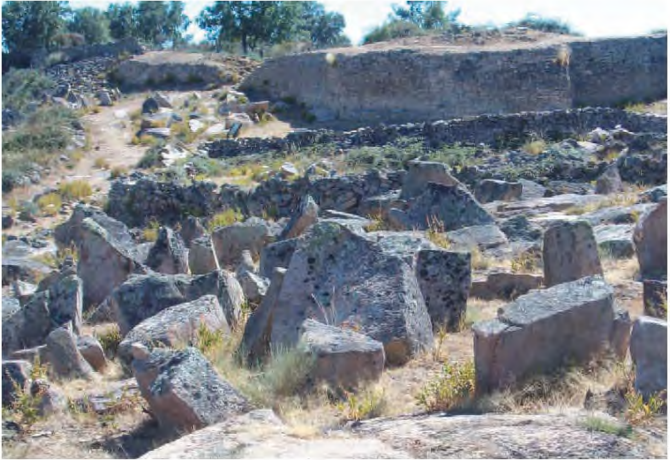
Castro de Saldeana (Salamanca), muralla y piedras hincadas.

chos yacimientos, encontrar los provebiales carteles explicativos completamente borrados, o casi, como resultado de la intemperie; o el mobiliario y las estructuras que se incorporan en algún caso al recorrido (se me ocurre La Mesa de Miranda, en Chamartín, Ávila) desgastadas o faltas de alguna pieza.