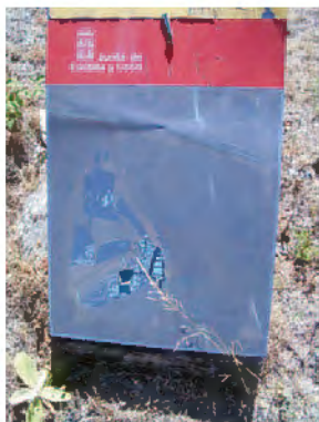
Cartel deteriorado del castro de El Raso (Ávila).