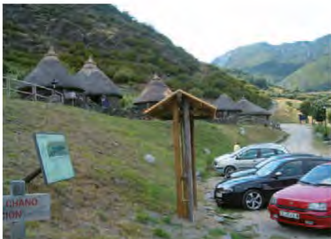
Parque arqueológico del castro de Chano (León).

El último y novedoso capítulo dentro de los métodos de difusión del patrimonio de la Edad del Hierro son los “parques arqueológicos”. El de Chano (León), en territorio astur, fue el primero, con la construcción, a corta distancia del yacimiento, de un recinto con varias pallozas destinadas a diferentes usos expositivos y hosteleros, un apar-