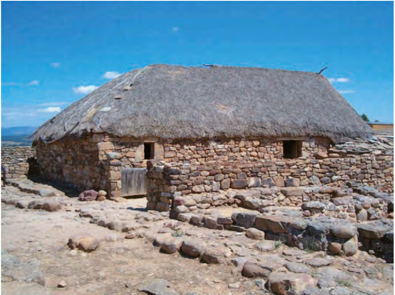
Casa reconstruida en Numancia (Soria).

para niños". Y es que ese afán divulgativo, enfocado equivocadamente, se convierte en vulgarizador, puede llegar a banalizar la Historia, y además sin haber conseguido ese fin proyectado. Quizás no sea yo la persona indicada, pero sí puede ser este el lugar adecuado para