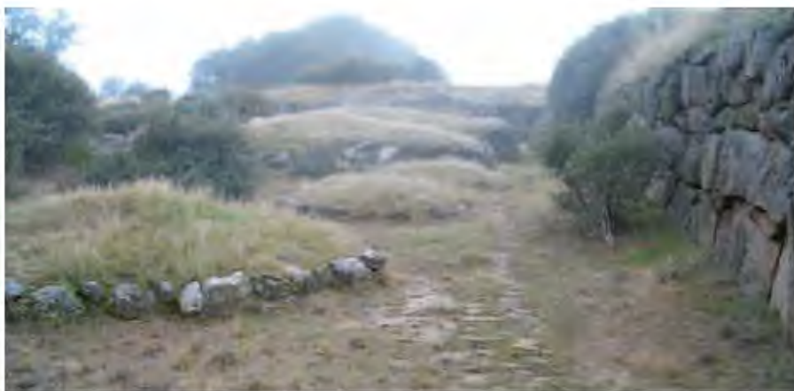
Túmulos de la necrópolis de La Osera, Chamartín de la Sierra (Ávila).

La de Pintia en Padilla de Duero (Valladolid) es la única en la que se ha realizado una actuación de cierta envergadura, con la incorporación de una placa para cada tumba excavada en la que se representan algunos de los objetos encontrados en ella e información sobre sexo, edad y cronología del individuo.